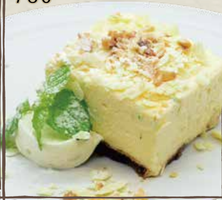
ダークチェリーと すだちのティラミス 780