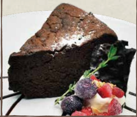
クラシック ガトーショコラ 680