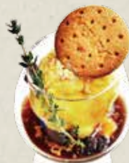
ラム酒 & エスプレッソ