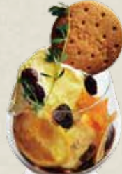
ドライフルーツ & バルサミコ