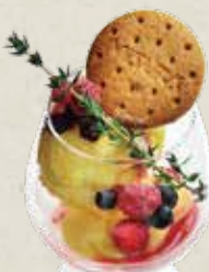
ベリー & ベリー