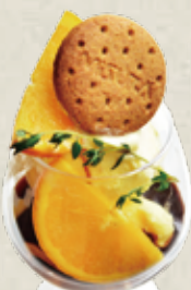
チョコレート オレンジ