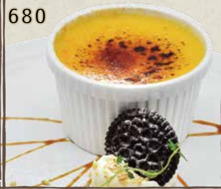
かぼちゃとレーズンの アーモンドミルク フリュレ 680