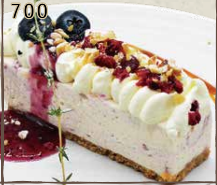
ブルーベリーの マーブル レアチーズケーキ 700