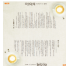
テーブルラッピング