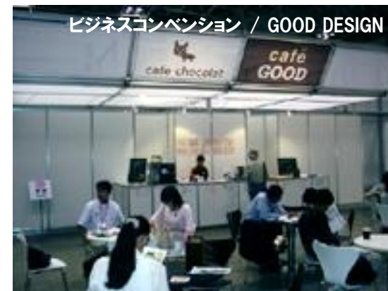
ビジネスコンベンション / GOOD DESIGN