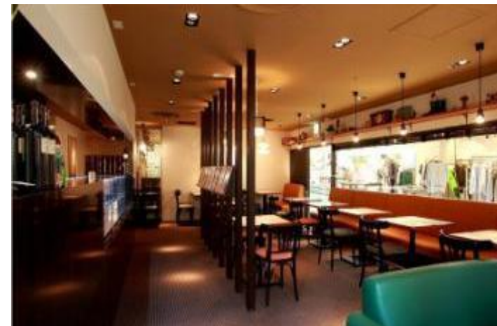
完成イメージ(当社実績 LCAFE) / サンプルラボ様

工事完了・物件引き渡し。スタッフの面接。厨房機器の設営。 イス・テーブルや内装詳細部分の設営。 2週間前からスタッフが入り、オープンシュミレーションを行います。