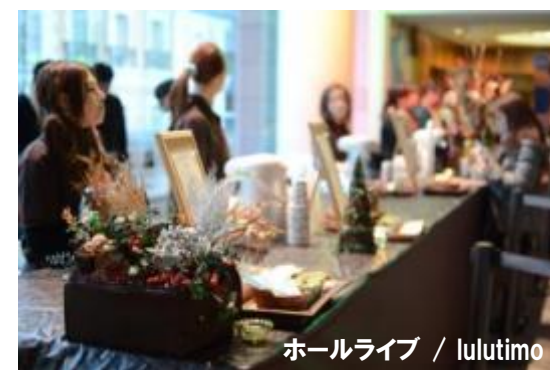
ホールライブ / lulutimo