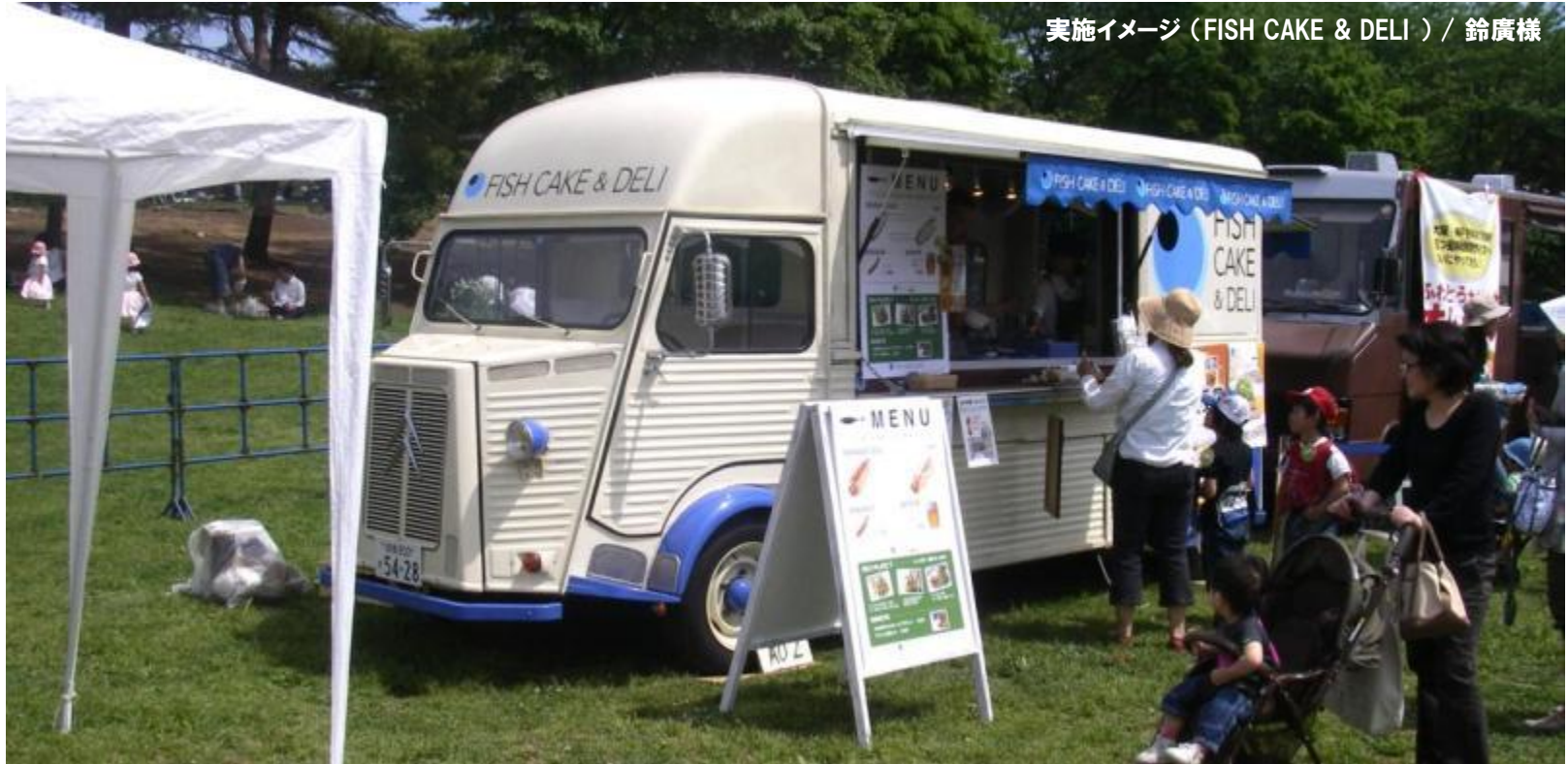
実施イメージ (FISH CAKE & DELI) / 鈴廣様