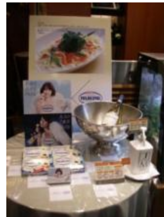
<写真上・左> 内外装裝飾・フェアメニュー作成 <写真下> オリジナルメニュー開発 ・ au様「biblio」メニュー開発 ・ JT様「PIANISSIMO」メニュー ・ Dole様 果物を使ったカフェスイーツ