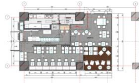
設計図面 平面図 イメージ

パース図をベースにした設計図面を作成し、造作上の細かいパーツを 固めていく段階となります。