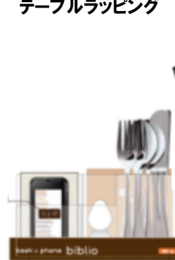
T & T カトラリーケース