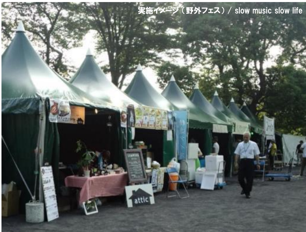
実施イメージ（野外フェス） / slow music slow life