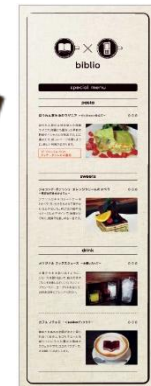
オリジナルメニュー