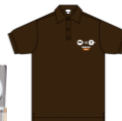
コスチューム ジャック