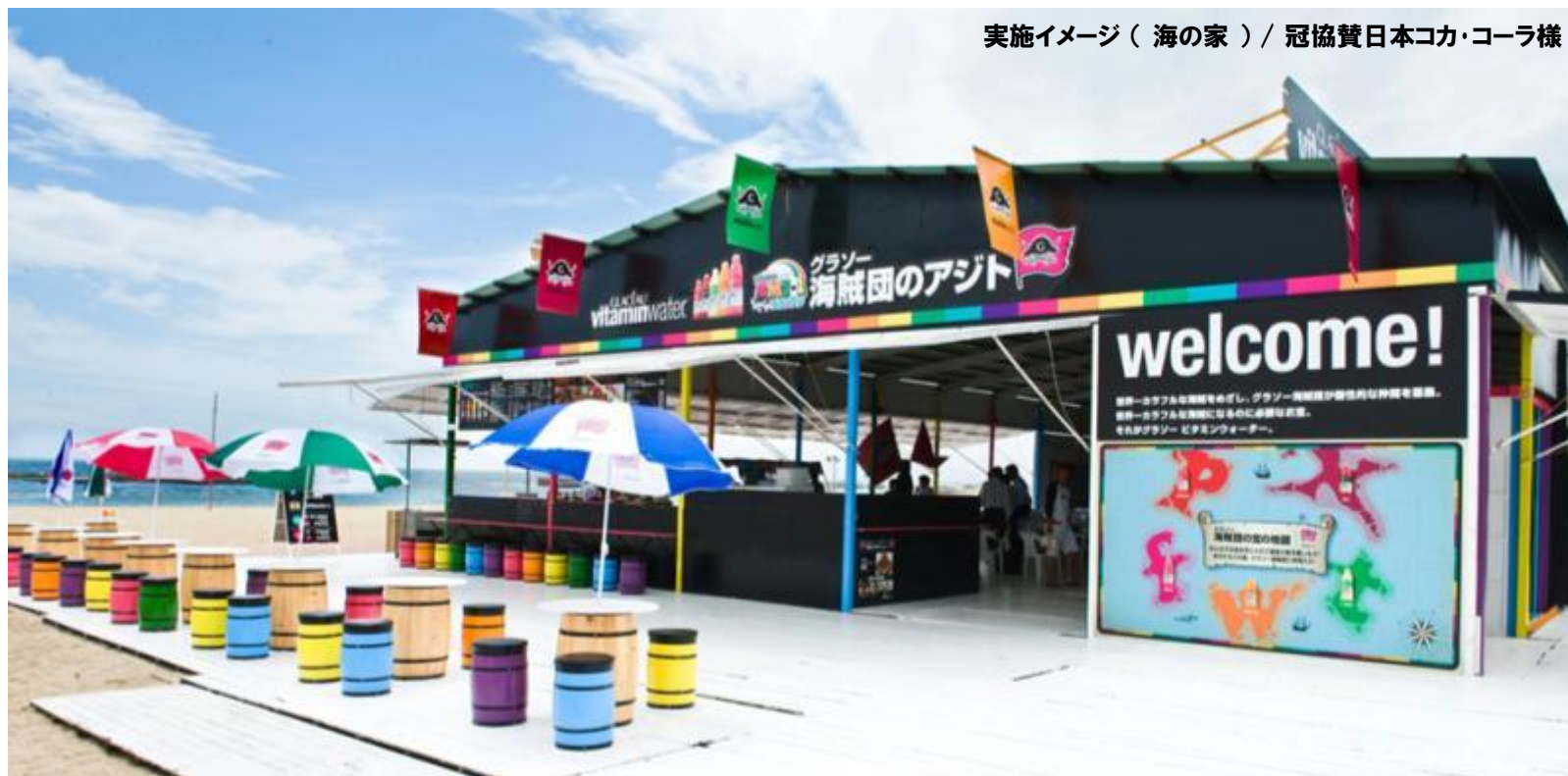
実施イメージ（海の家） / 冠協賛日本コカ・コーラ様